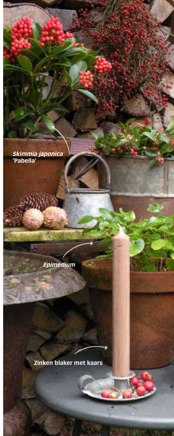
Skimmia japonica 'Pabella'

De pot rechtstreeks op de tafel zetten is het beste voor de plant, maar het is minder goed voor je tafel. Zelf zorg ik ervoor dat ik de planken om de vijf jaar vervang. Een oude deur is trouwens ook een geweldige ondergrond voor al je potten.