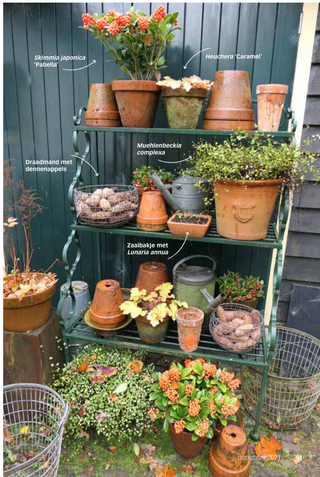
Skimmia japonica 'Pabella'